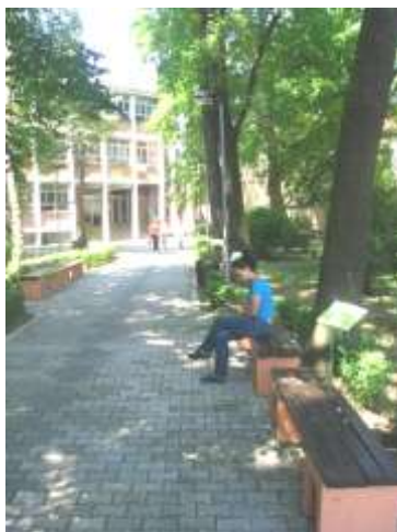
Зграда и парк Факултета

Педагошки факултет у Јагодини је 18. 1. 2009. године добио Уверење о акредитацији високошколске установе, прописане Правилником о стандардима и поступку за акредитацију високошколских установа и студијских програма („Службени лист РС“ бр. 106/06).