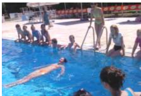
Испит из изборних предмета